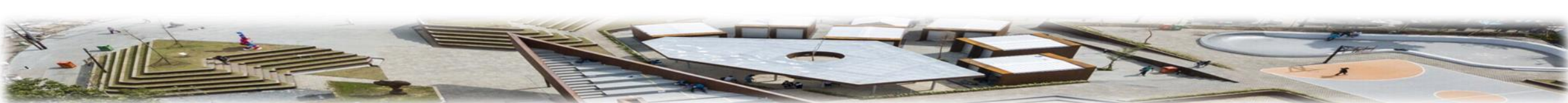
Tabel 2.1 (T-C.29)