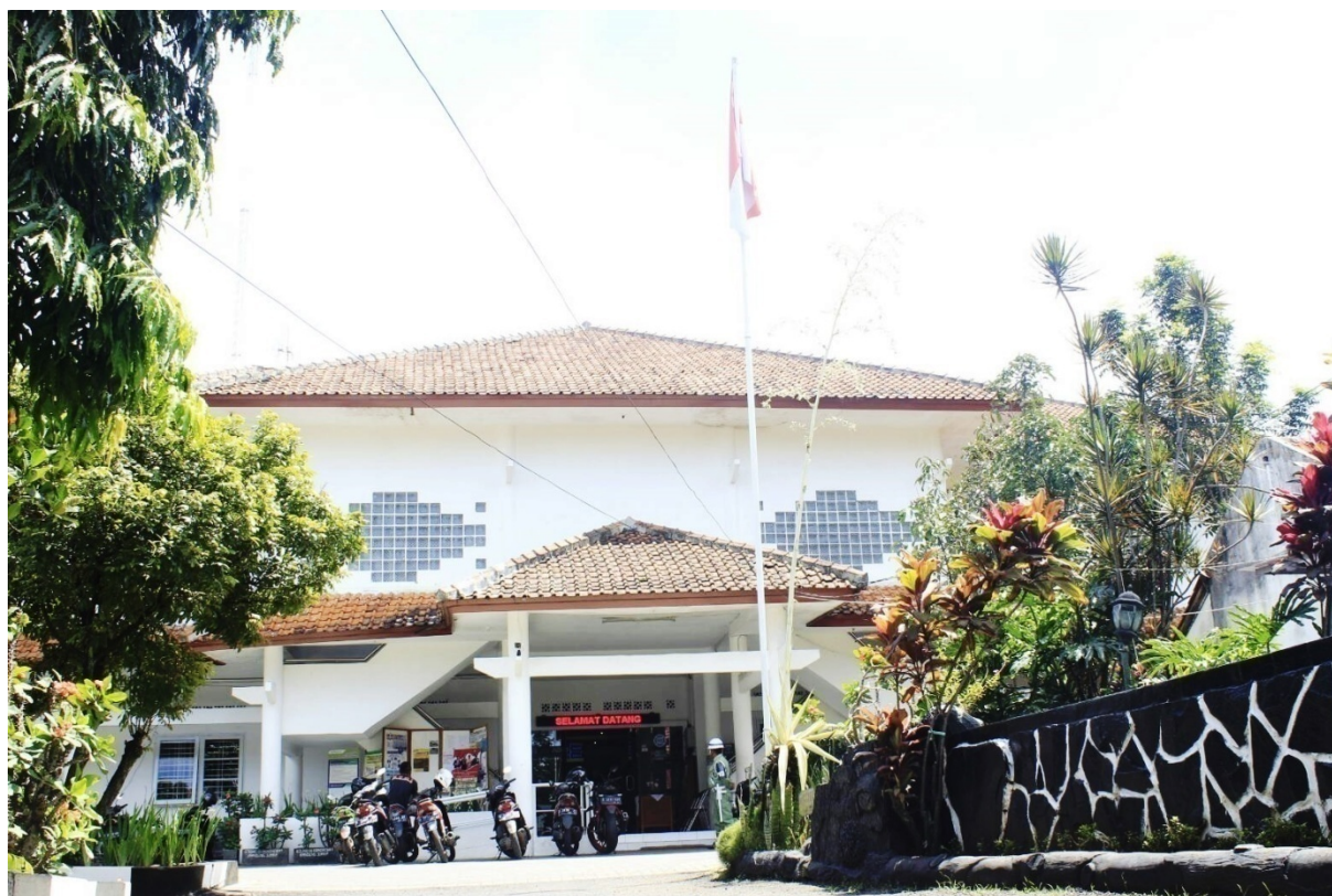
FOTO Kantor Kecamatan Ujungberung